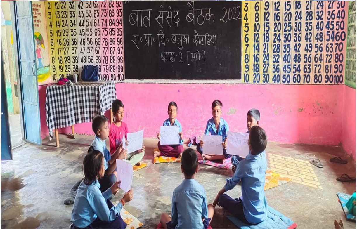
बाल संसद में बैठक करते बच्चें।