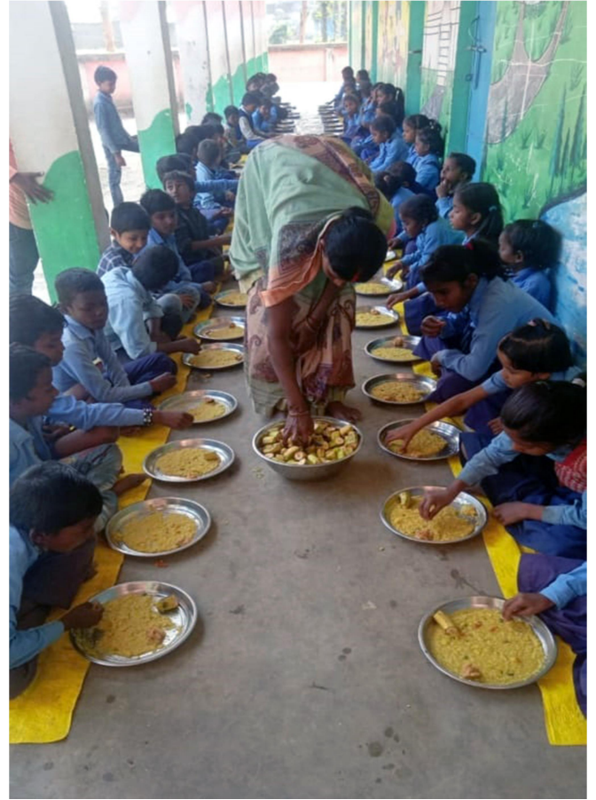
पोषक वाटिका एंव मध्याह्न भोजन करते बच्चे ।